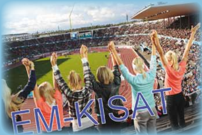
YAG:n osallistajat pääsivät aistimaan EM-kisojen tunnelmaa Helsingin Olympiastadionille.