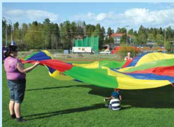
Perheen pienimmille oli tarjolla muun muassa leikkivarjo-piste.

Urheilukentälle oli rakennettu erilaisia voimistelun ja yleisurheilun lajipisteitä. Tapahtumassa pystyi muun muassa haastamaan kaverinsa – ja miksipä ei naapurinsakin – esimerkiksi säkkihyppelyssä. Unelmien liikuntapäivässä oli myös mahdollisuus kokeilla muun muassa korkeushyppyä, keihäänheittoa ja hyppynaruhyppyä. Koulutetut ohjaajat molemmista seuroista auttoivat ja opastivat. Yhteisjumbassa kaikki pääsivät liikkumaan ohjaajien johdolla. Sanaseikkailuun osallistuneiden kesken arvottiin palkintojakin. Kahviosta sai ostaa rahalla, ja pomppulinnaankin pääsi pientä maksua vastaan.