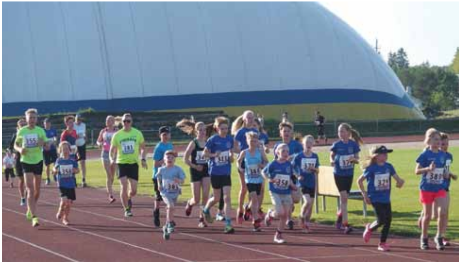
Viimekeväinen Kunniakierros keräsi taas Klaukkalan kentän juoksuradalle monenikäistä liikkujaa.

Kunniakierros on Suomen Urheiluliiton jäsenseurojen yhteinen varainkeruutapahtuma, missä kerätään rahaa erityisesti nuorisourheilun hyväksi kiertämällä tunnin ajan urheilukenttää joko juosten tai kävellen. Osallistujat keräävät itselleen tukijoita, jotka osallistuvat keräykseen joko