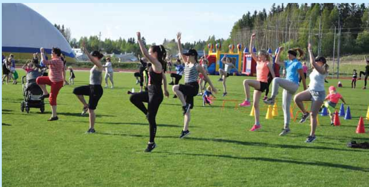
Urheilijat ja ohjaajat osallistuivat yhteisjumbaan innokkaasti hymyssä suin.

Urheilukentälle oli rakennettu erilaisia voimistelun ja yleisurheilun lajipisteitä. Tapahtumassa pystyi muun muassa haastamaan kaverinsa – ja miksipä ei naapurinsakin – esimerkiksi säkkihyppelyssä. Unelmien liikuntapäivässä oli myös mahdollisuus kokeilla muun muassa korkeushyppyä, keihäänheittoa ja hyppynaruhyppyä. Koulutetut ohjaajat molemmista seuroista auttoivat ja opastivat. Yhteisjumbassa kaikki pääsivät liikkumaan ohjaajien johdolla. Sanaseikkailuun osallistuneiden kesken arvottiin palkintojakin. Kahviosta sai ostaa rahalla, ja pomppulinnaankin pääsi pientä maksua vastaan.