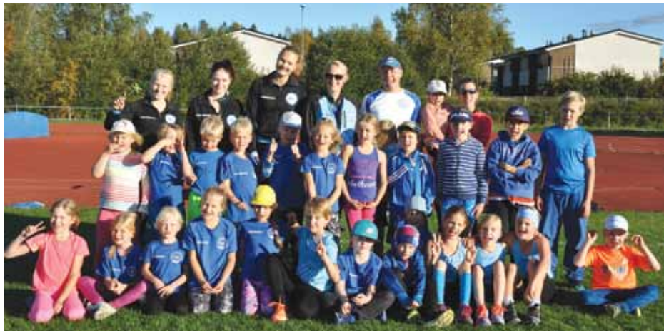
Ohjaajat ja pienet urheilijat kokoontuivat kesäkauden päätteeksi yhteiskuvaan.

Kesän 2016 yleisurheilukoulukausi päättyi 8. syyskuuta "olympialaisiin". Sininen ja valkoinen ryhmä yhdistettiin ja jaettiin sitten joukkueisiin. Jokainen ohjaaja sai oman joukkueen, missä oli lapsia kaikista yleisurheilukoulun ikäluokista.